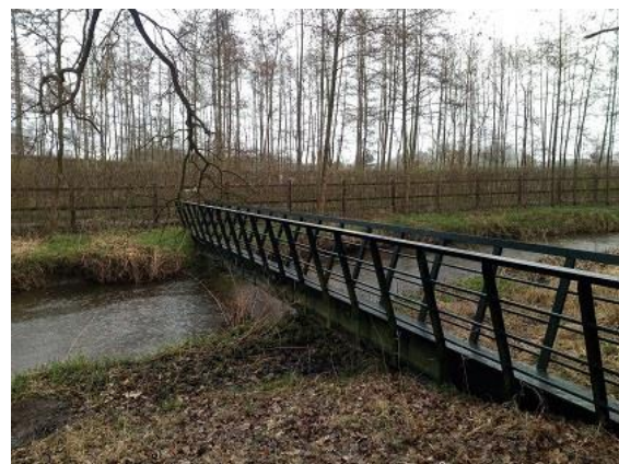
(Afb. Bruggetje (betaald door gemeente) met smal pad dat over perceel landgoed loopt met daarachter dicht hekwerk.)

Begin juni is er een brief naar het college van Waalre verzonden i.v.m. de ontwikkelingen van landgoed Eeckenroode aan de Achtereindsestraat in Aalst. Dit landgoed houdt zich al langer niet aan de regels voor de ontwikkeling van een landgoed met fiscale voordelen. Aan de ontwikkeling van een landgoed worden voorwaarden gesteld door de provincie en het rijk. Als aan deze voorwaarden voldaan wordt kan de eigenaar van het landgoed aanspraak maken op fiscale voordelen en subsidies. Dit omdat de eigenaar ook moet investeren in nieuwe natuur en dus een afwaardering van de huidige, vaak landbouwgronden, heeft. Voorwaarden zijn o.a. het ontwikkelen van nieuwe natuur en het openstellen van meerdere paden over het landgoed voor publiek.