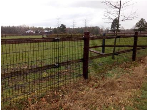
(Afb. Zicht op paardenweide met dicht hekwerk en op de achtergrond het zog. Bedrijfsgebouw)

Als bijvoorbeeld aan deze voorwaarden is voldaan, dan mag de eigenaar een nieuw landhuis bouwen. Helaas zien we bij Eeckenroode dat het landgoed volledig in dienst staat van de polo activiteiten, dus paardenweiden, wat de natuur niet ten goede komt. Tevens is er een dusdanig dicht hekwerk rondom geplaatst dat dieren niet vrij kunnen migreren tussen de aangrenzende bossen en het landgoed.