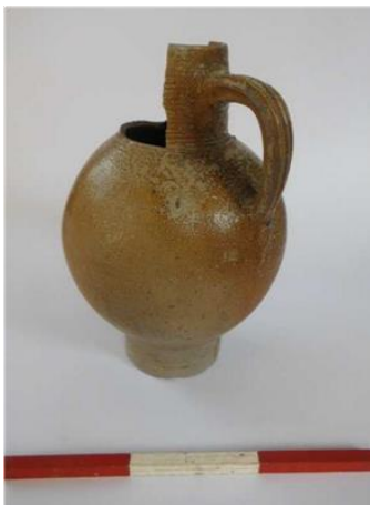
Steengoed kan 16e-17e eeuw

Het vondstmateriaal wordt momenteel door Econsultancy verder onderzocht, en zal uiteindelijk in het provinciale depot in Den Bosch worden opgeslagen. Na de opgraving is het opgegraven terrein vrijgegeven voor de toekomstige bebouwing.