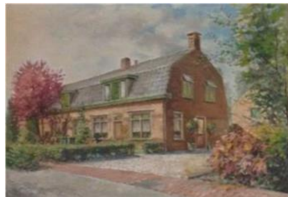
De inmiddels gesloopte boerderij aan de Kromstraat 42-44.

gebouwd op de resten van een oudere boerderij, die al op de kadasterkaart uit 1832 zichtbaar was. Aan de voorzijde van de boerderij is een vermoedelijke waterloop uit de 17e eeuw aangetroffen.