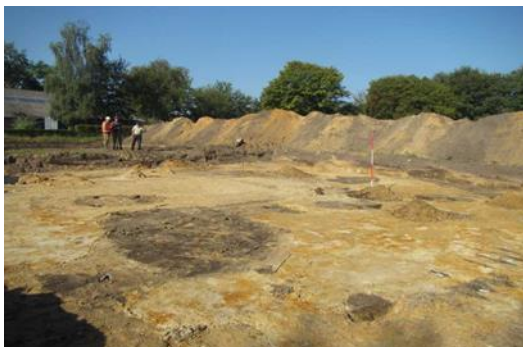
Impressie van de opgraving

Aan de Kromstraat 42-44 in Valkenswaard zijn in september de resten blootgelegd van een achtererf van een boerderij uit vermoedelijk de 16e eeuw. Het onderzoek is uitgevoerd door Econsultancy met medewerking van vrijwilligers van de Heemkundekring Weerderheem. Ter plaatse van de opgraving worden twee bouwkavels ontwikkeld die binnenkort te koop zijn. Vanwege de bodemverstoringen door saneringen en bebouwing zijn alleen nog de dieper gelegen archeologische resten overgebleven.