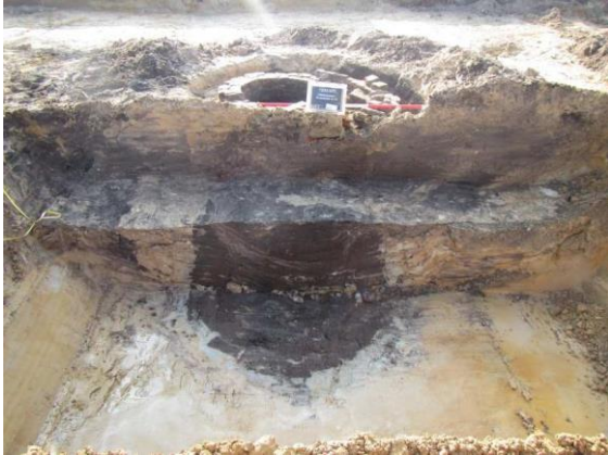
Plaggenput op de voorgrond en stenen put erachter

putten worden veelal gave vondsten aangetroffen. Een nagenoeg complete steengoed kan uit de 16-17e eeuw (zie afbeelding) is hierbij tevoorschijn gekomen. Putten zijn daarnaast een belangrijke bron van goed geconserveerde organische resten, zoals hout, bot en leer, maar ook van zaden en pollen.